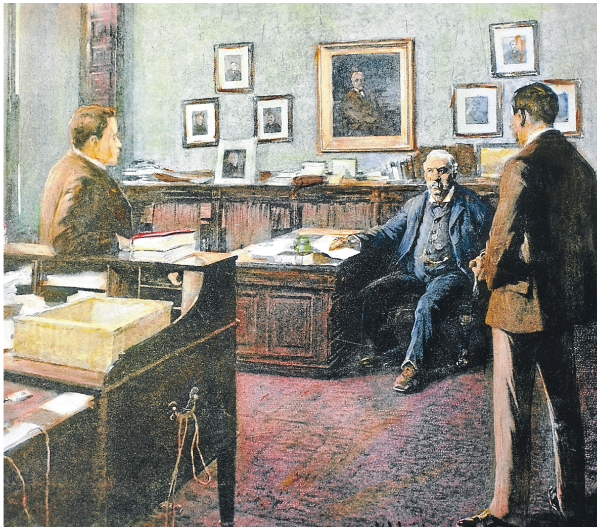
John Pierpont Morgan (1837-1913), financier et banquier américain, ici dans son bureau vers 1900.